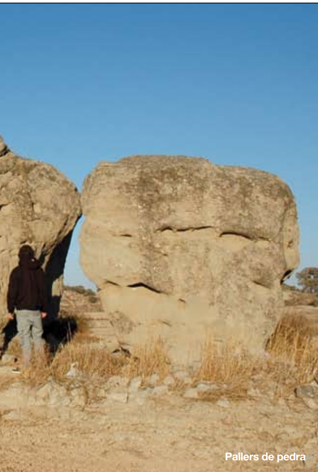
Pallers de pedra