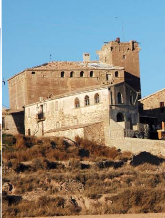
El castell dels pallers