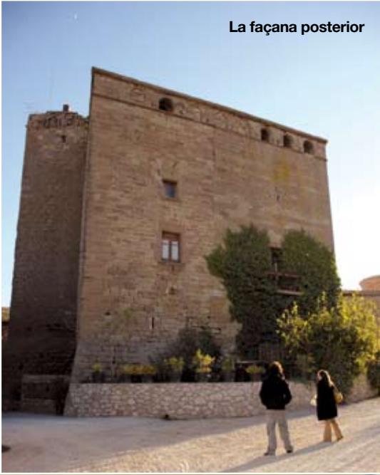
La façana posterior