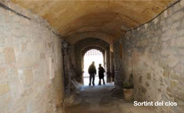
Sortint del clos