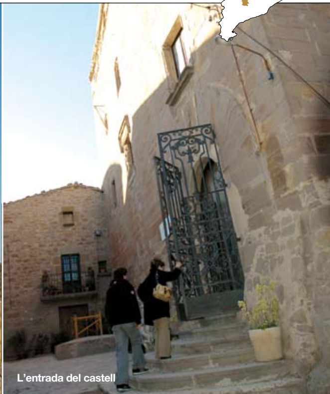
L'entrada del castell