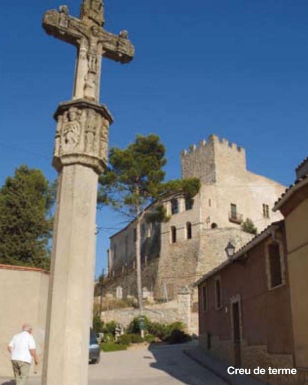
Creu de terme