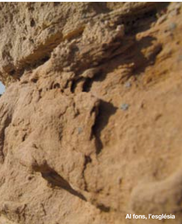
Al fons, l'església