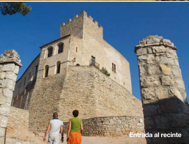
Entrada al recinte