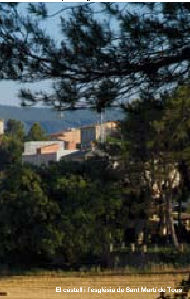
El castell i l'església de Sant Martí de Tous