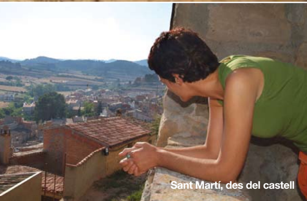
Sant Martí, des del castell

mits especials com el del salt d'aigua anomenat la Fou, que ha donat lloc a moltes tradicions i llegendes.