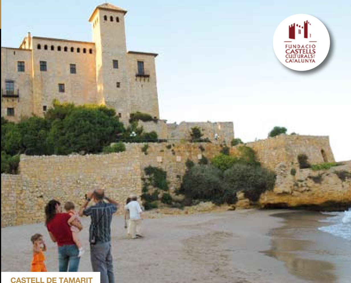
CASTELL DE TAMARIT