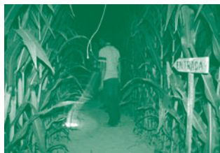
Laberint de blat de moro