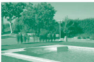
Allotjaments Cal Tonet / El Colomar

El laberint es troba dins de Masia Esperança, una finca agrícola al poble de Castellerà (Urgell - Lleida). A més la finca ofereix la possibilitat de fer-hi estada en allotjaments rurals amb piscina: Cal Tonet: de 4 a 7 places El Colomar: de 2 a 5 places