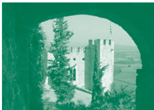
Castell de Montsonís